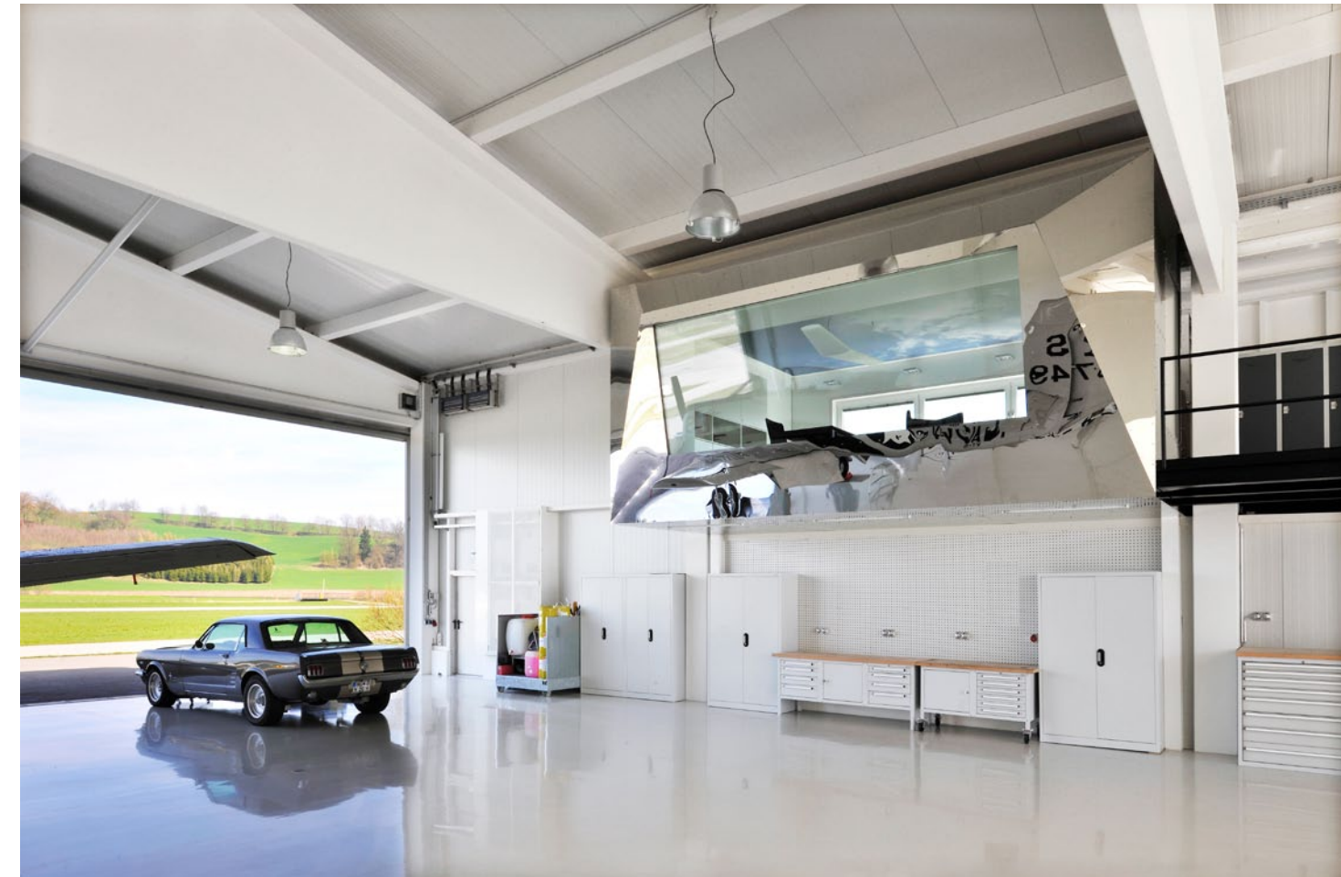
DAS BÜRO SCHWEBT IM HANGAR