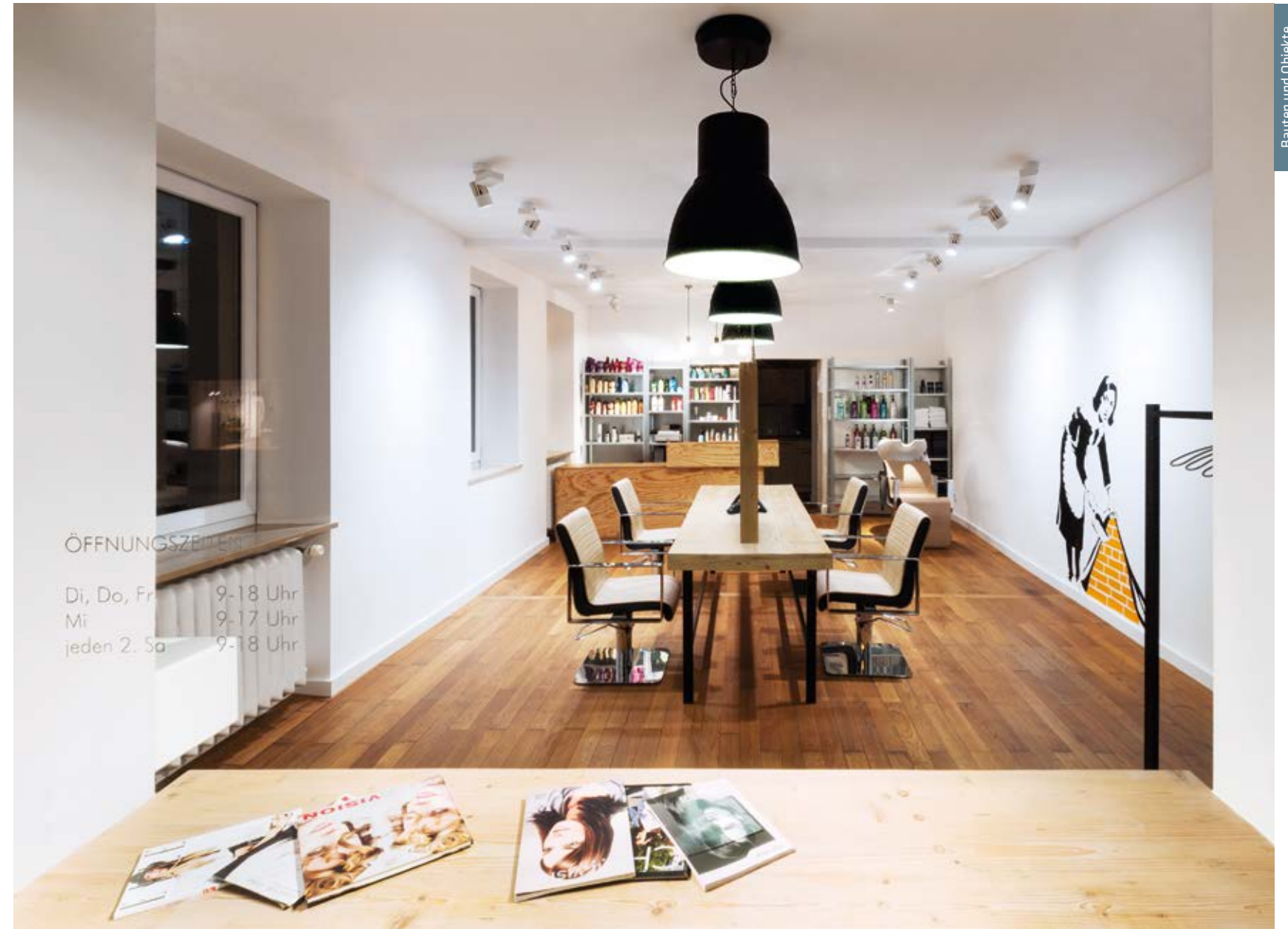
Blick ins Schaufenster

The conversion of a former record shop into a hairdressing salon with the help of studio lot brought about a casual and witty hair workshop. Similar to a good hairstyle, the atmosphere of Salon Franciski reflects the owner's personality.